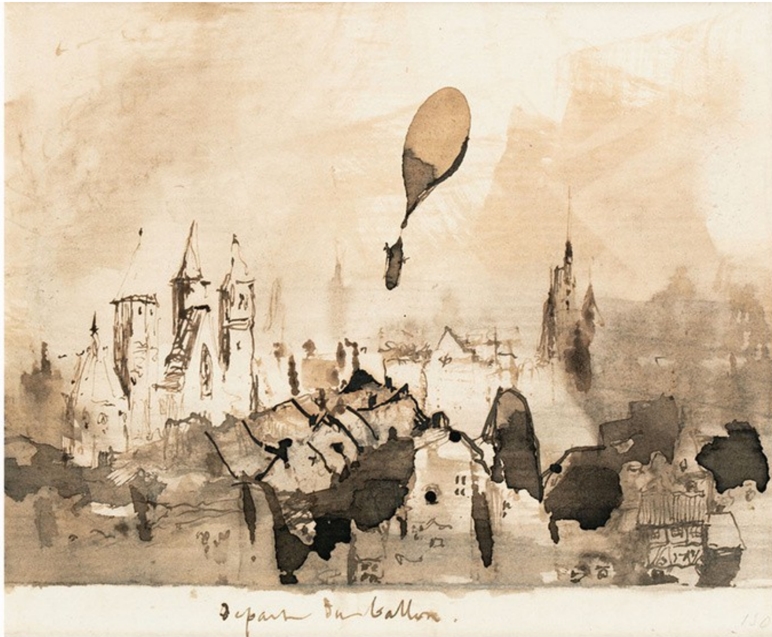
Départ du ballon de Victor Hugo