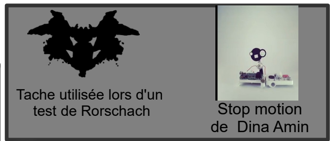
Tache utilisée lors d'un test de Rorschach