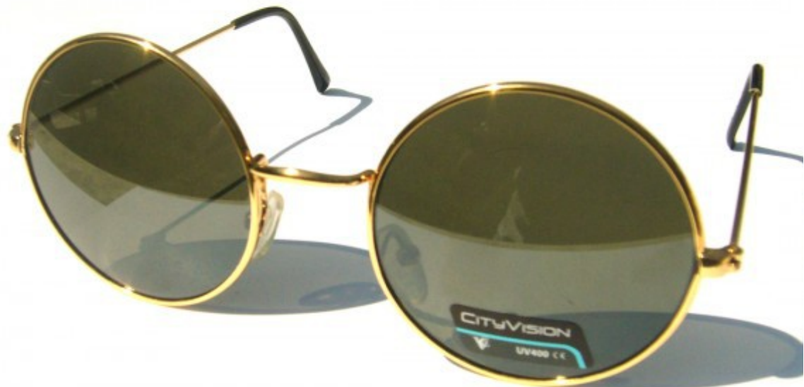
Des lunettes/ Se protéger du soleil