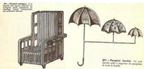
1969 Images extraites du Catalogue des objets introuvables de Jacques Carleman