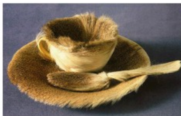
1936 (Surréalisme) Le déjeuner en fourrure Meret Oppenheim