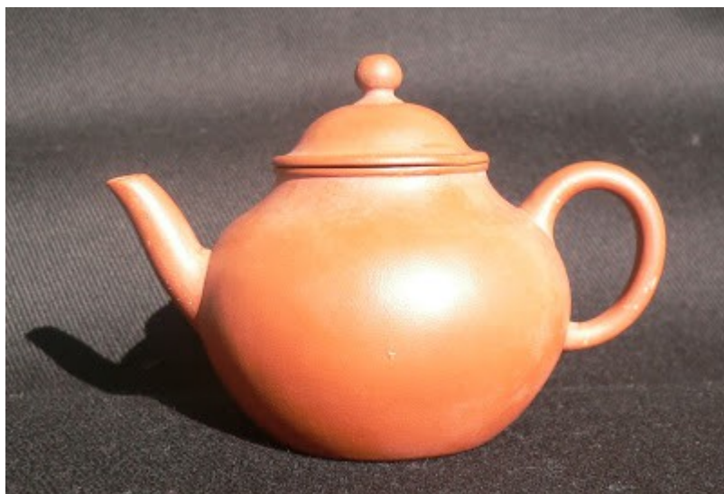
Une théière/ Servir du Thé Un bec verseur Une hanse