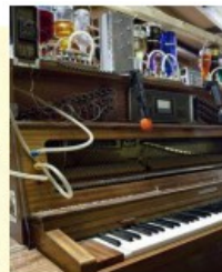
2013 ★ Pianocktail du film L'écume des jours de Michel Gondry