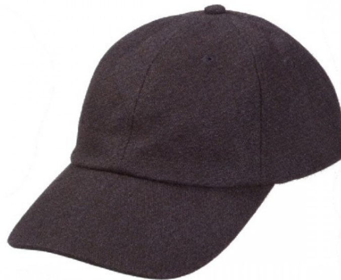
Une casquette/ Se protéger du soleil Une visière